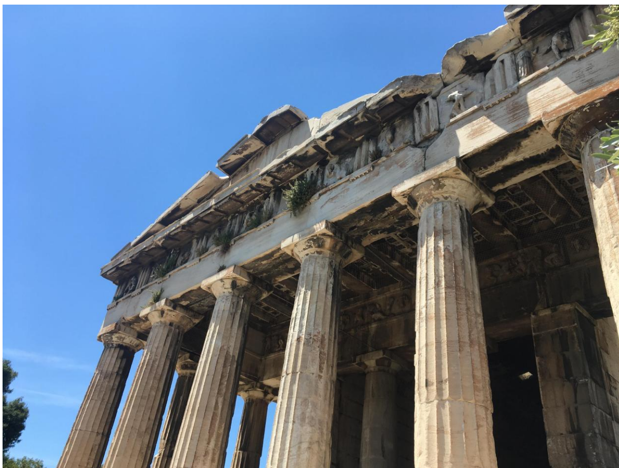
Zdjęcia z prywatnych zbiorów